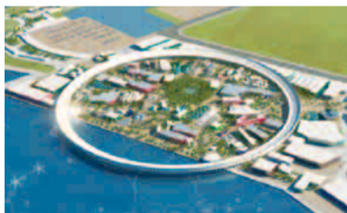
万博会場全景

※今後、市町村と連携・協力した複数回の招待について、市町村と調整を重ねながら検討